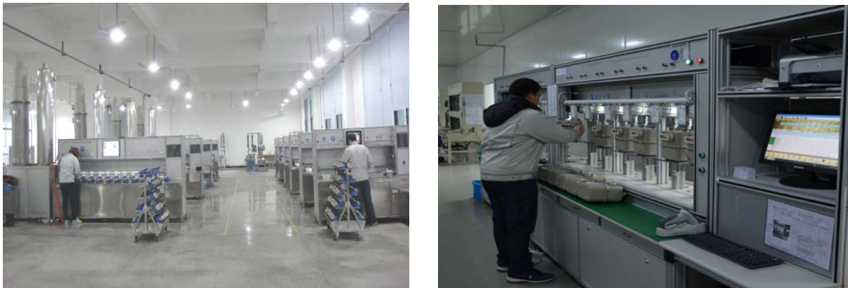
图 6 部分检测设备

公司始终将检测能力的提升视为质量管理的重要环节，在检验设备上加大投入，测试设备先进，检测手段齐全。同时重视质检人员的业务素质的提高，通过多种渠道的培训，使操作人员、质量管理和控制人员具备多种的资格证书，导入 ISO/IEC17025: 2017《校准和检测实验室能力认可通用要求》标准，建立实验室管理体系并进行运行，规范实验室管理并进行 CNAS 认可申报，从而保证了产品的高质量和科学的检验检测。用实际行动践行“百年大计、质量第一、科技领先、顾客至上”的质量理念。