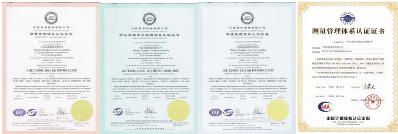
图 4 体系认证证书

为确保体系的高效运行、持续改进，采用内审+外审的体系运行模式，针对存在的问题和不足之处，开立不符合项，要求整改并进行标准化；结合管理提升活动，对管理文件、记录进行梳理，真正实现闭环式管理和文件的标准化。