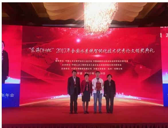
图 7 承办行业协会