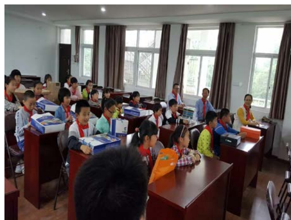
图 8 助学献爱心