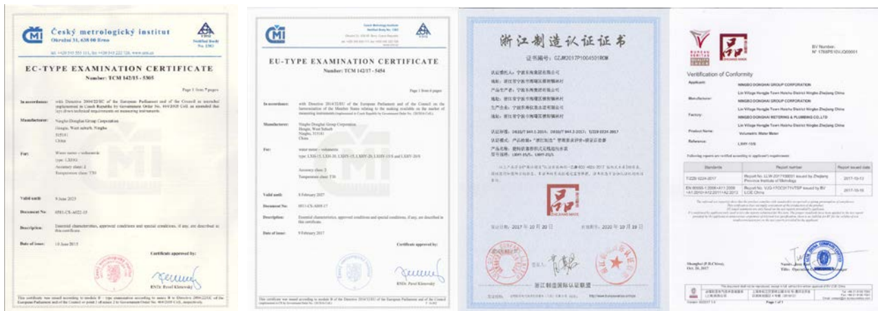
图 5 部分产品认证证书

(2) 企业通过产品认证促进自身技术进步，提高了产品性能质量。一直以来，东海十分注重认证工作的开展和申报工作。通过多年的努力，产品销往世界各地并满足所销售国家及地区的法律法规与标准要求，取得并通过相关认证，如：3C、MID、“浙江制造”等国内外强制性认证与自愿性认证。