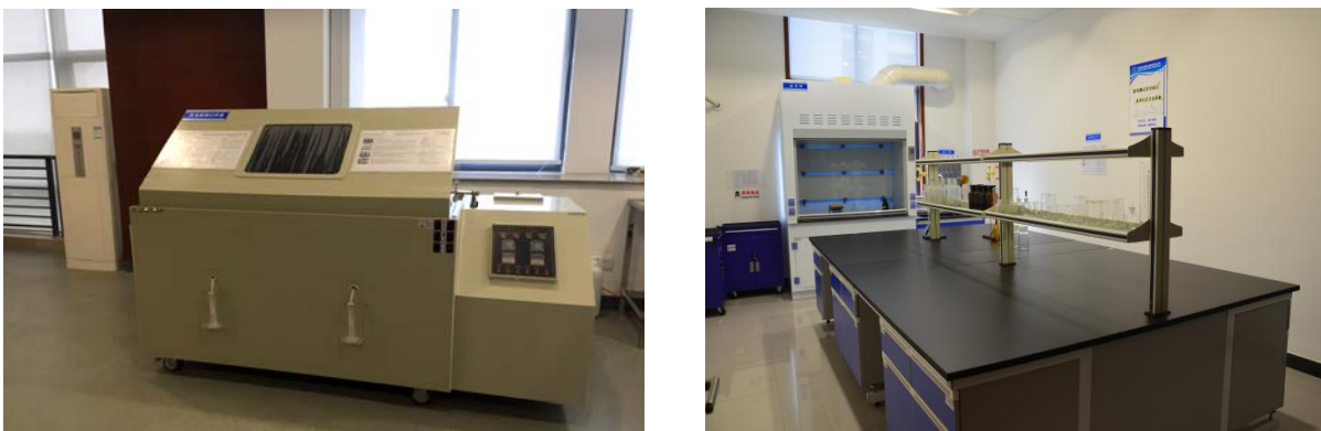
图 2 中心实验室

公司层面设有独立的质量管理职能部门，对质量策划、质量控制、质量保证和改进等各方面进行领导、协调、组织、管理和监督，贯彻落实公司最高层面的质量决策。公司下属各制造单位均单独设立品质管理部门，主导生产过程质量的控制。全公司由上至下规范各级管理者及各岗位员工的质量职责和权限，明确产品各环节的质量标准、质量控制和质量改进，持续提高产品质量，不断增强质量意识；通过合理化建议、提案改善等活动激励全体员工参与质量建设和改进。